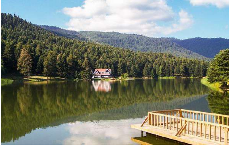
ABANT LOTUS OTEL VE RESTAURANT

Bolu’ya seyahat için her dönem ayrı bir güzellik sunar. Kışın kayak ve kar tutkunlarına yazın yayla ve gölleri ile serinlik ve huzur. Sonbaharda rengarenk ormanları fotoğraf tutkunlarının uğrak yeridir. Bunun yanı sıra Abant her mevsim ayrı bir güzelliğe büründüğü için sonbaharda da ziyaret edilir. Bolu seyahatine ne zaman çıkacağınız tamamıyla size bağlı olup; kayak için kış mevsimini, doğa içinde huzurlu bir gezi için ilkbahar veya yaz mevsimini tercih edebilirsiniz.